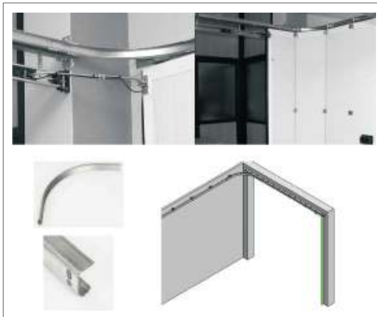
GUÍA CURVA SUPERIOR